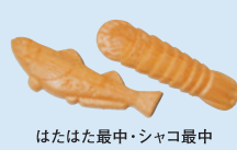
はたはた最中・ジャコ最中