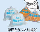
厚田とうふと油揚げ

海のしずく(にがり)と大地の恵(大豆)を素材にした健康食品である厚田豆腐、油揚げを毎日作っております。