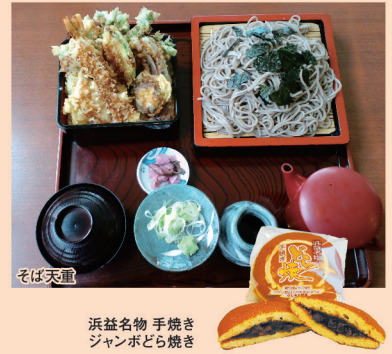
浜益名物 手焼きジャンボどら焼き